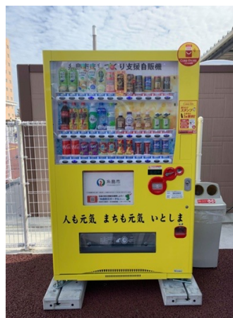
福岡県糸島市 自動販売機モデル