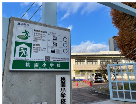
大阪府高槻市 防災看板モデル